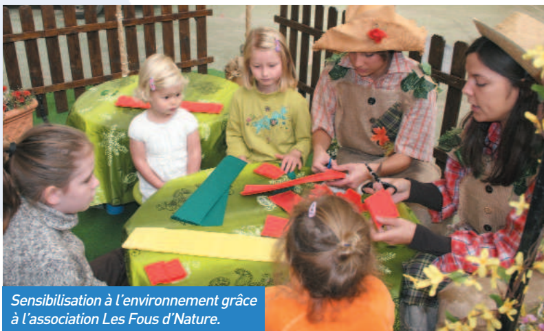
Sensibilisation à l'environnement grâce à l'association Les Fous d'Nature.

Municipal d'Expression Musicale a ensuite offert un concert. Des compositions végétales avaient été installées dans la salle par le service environnement de la Ville et, toute la journée, animations et démonstrations ont été proposées. Le midi, près de 200 repas ont été servis. Et, pendant le forum, on a compté plusieurs centaines de visiteurs.