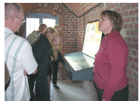
Le musée du Fort de Seclin et sa collection sur 14-18 ont beaucoup intéressé le public.