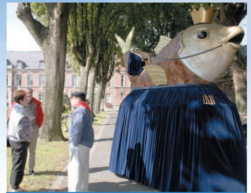
À l'hôpital Notre-Dame, Harengus Junior était présenté par les Amis des Géants.

de 1918, la visite intitulée "Seclin, 14-18, ville occupée" a fort intéressé le public de même que la visite du Fort et les films diffusés dans ce lieu sur la période. Beaucoup de monde a assisté à la visite du chantier de fouilles archéologiques près de la collégiale, le dimanche matin. Dans l'édifice, des explications ont été données sur le fonctionnement de l'orgue et, le dimanche, un concert de carillon a été donné. Sans oublier la visite du canal, du Domaine Napoléon et les balades "aquarelle".