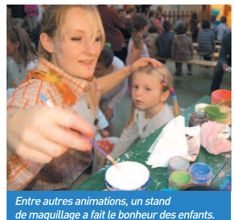
Entre autres animations, un stand de maquillage a fait le bonheur des enfants.