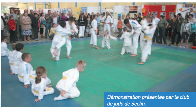
Démonstration présentée par le club de judo de Seclin.