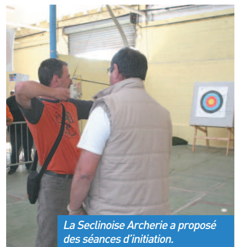
La Seclinoise Archerie a proposé des séances d'initiation.