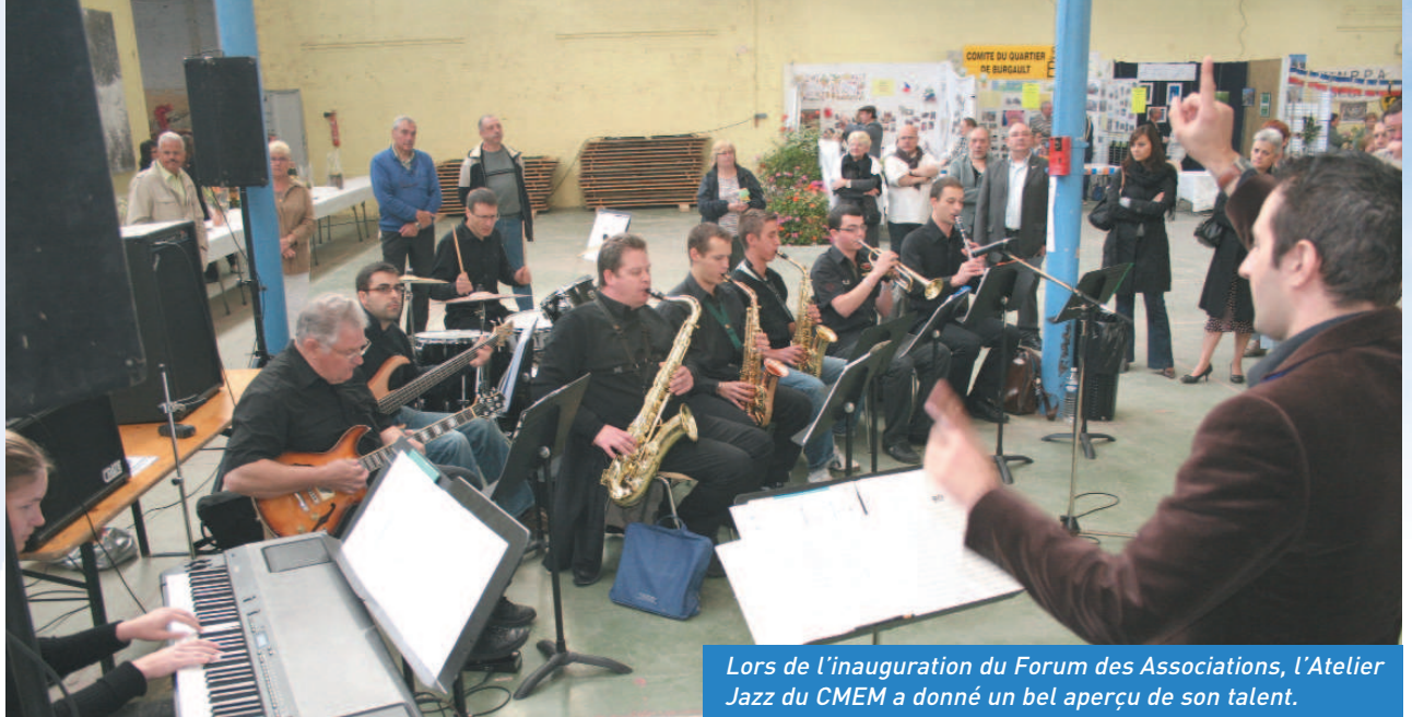
Lors de l'inauguration du Forum des Associations, l'Atelier Jazz du CMEM a donné un bel aperçu de son talent.