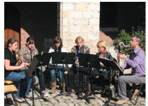
Musiciens et professeurs du CMEM ont été applaudis, cour carrée de l'hôpital Notre-Dame.